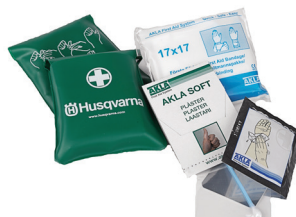
KIT DE PRIMEROS AUXILIOS 504 09 53-01