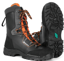
BOTAS SEGURIDAD CLASSIC 20 597 65 94-39