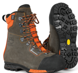
BOTAS DE CUERO FUNCIONAL 24 597 65 93-38