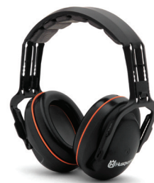
PROTECTOR AURICULAR 505 66 53-04