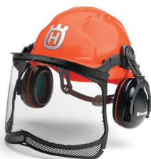
CASCO FORESTAL, CLASSIC 580 75 43-01