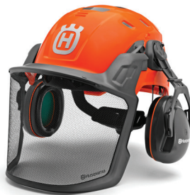
CASCO FORESTAL, TECHNICAL 585 05 84-01